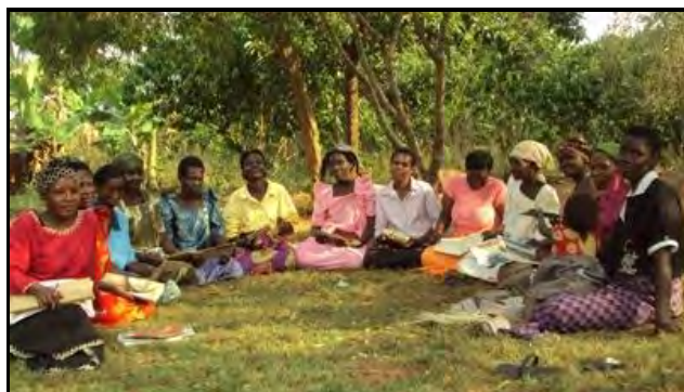
Groupe bénéficiaire du projet à Jinja

165 familles ont reçu des prêts en 2011. 1'039 personnes ont donc bénéficié de ce projet si l'on considère qu'en moyenne, 5,3 personnes dépendent de la personne recevant un crédit. Le renforcement des compétences des bénéficiaires est un point clef du projet. Des formations en gestion de crédit et d'épargne, ainsi qu'en entrepreneuriat ont été dispensées. Les activités génératrices de revenu menées par les bénéficiaires incluent l'élevage de bétail et la gestion de petits commerces. A long terme, elles permettent aux parents de répondre aux droits fondamentaux des enfants. Les procédures du projet ont également été révisées pour améliorer son efficacité et le contrôle.