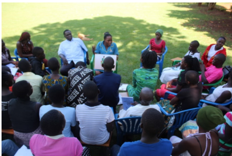
Les jeunes de Omoana House pendant une présentation des méthodes de planning familial.