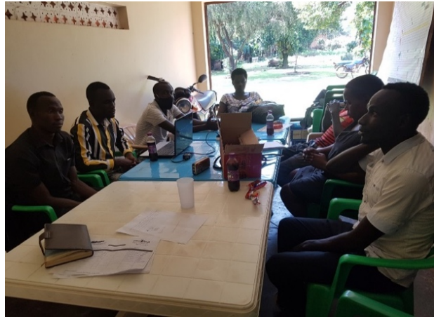
Réunion d'étudiants de Handle.

Omoana s'investi dans l'éducation des enfants afin de contribuer à leur offrir des perspectives d'avenir. En 2020, 52 enfants ont été scolarisés grâce à l'association. Les enfants résidants à Omoana House se rendent à l'école voisine « Njeru Parents School », et ceux de St. Moses dans l'école attenante « St. Moses Primary School ».