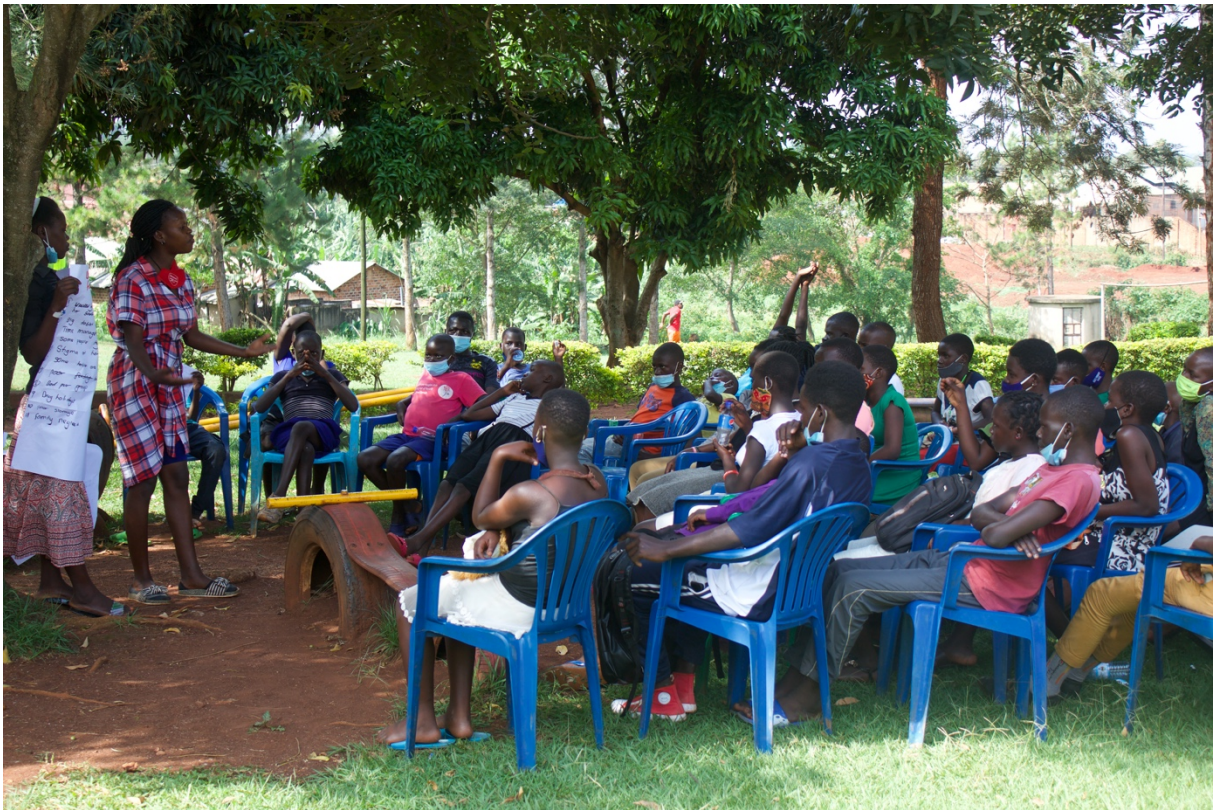
Session de formation des éducateurs pairs à Omoana House.

Association Omoana Promouvoir des droits et des perspectives d'avenir pour la jeunesse Ougandaise